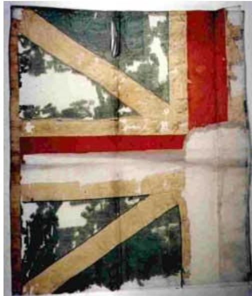
Una de las banderas británicas capturadas y que pertenecía a un descendiente de Bernardo de Gálvez que en 1903 la donó al Museo de Artillería

"el 10 (10-V-1781) a las 3 de la tarde se formaron a 500 varas del fuerte Jorge 6 cias. de granaderos y las de cazadores de la Brigada francesa, a cuya distancia salió el General con su tropa y después de haber entregado las banderas del Regimiento Waldeck, y una de artillería, con las ceremonias acostumbradas rindieron sus armas".