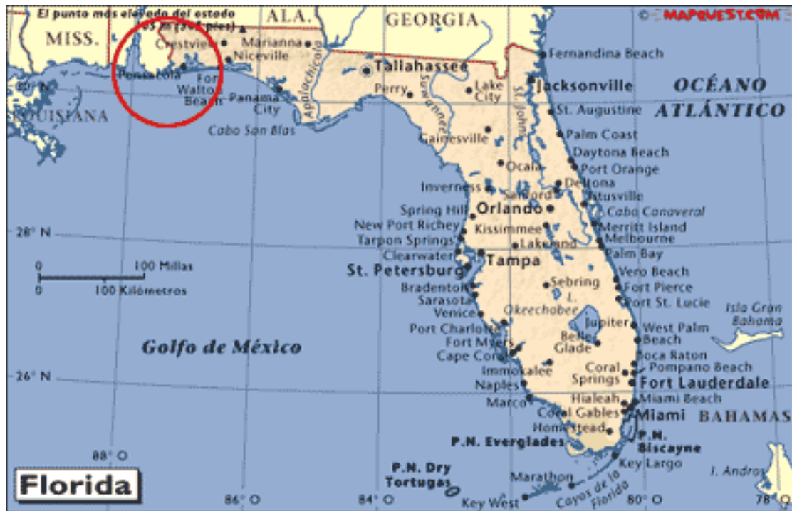
Mapa actual de Florida. En círculo rojo donde se encuentra Pensacola.

De hecho, Gálvez había estado realizando preparaciones militares meses antes de la declaración oficial de guerra. Había estado manteniendo un servicio eficaz de espionaje en territorio británico desde 1777.